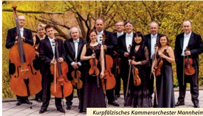
Kurpfälzisches Kammerorchester Mannheim